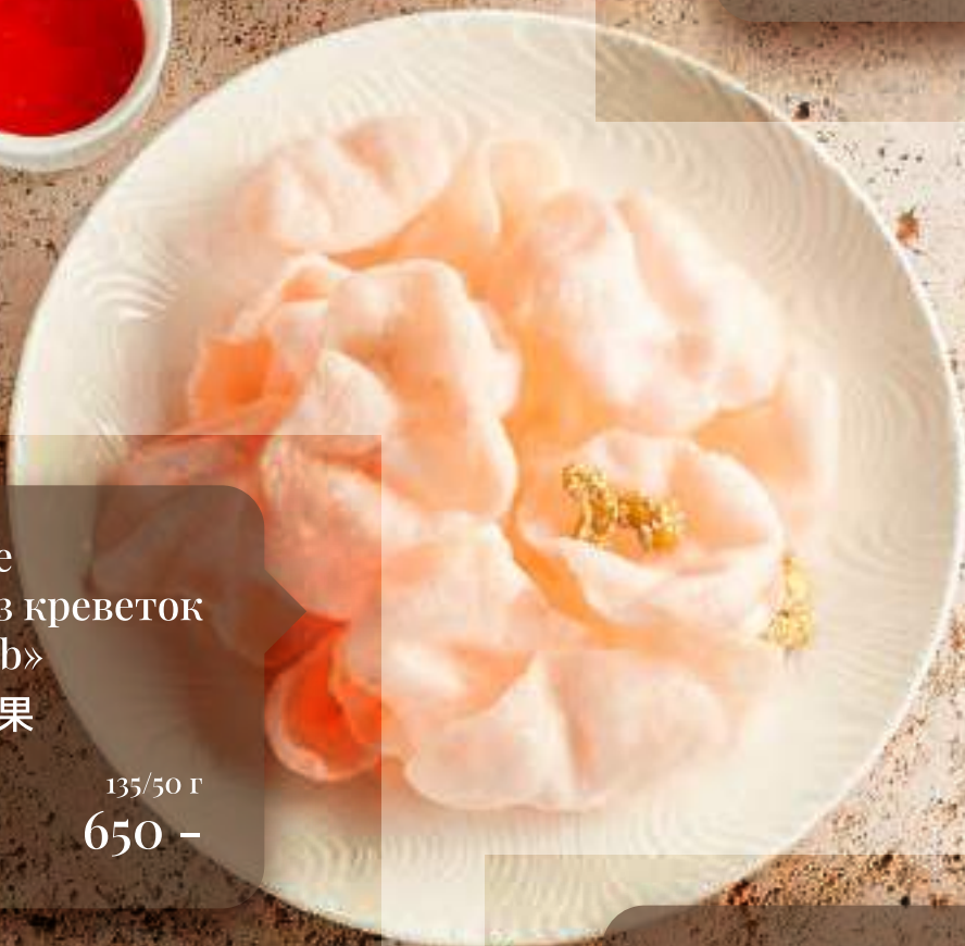
Воздушные крекеры из креветок «Soluxe club» 虾片琥珀腰果