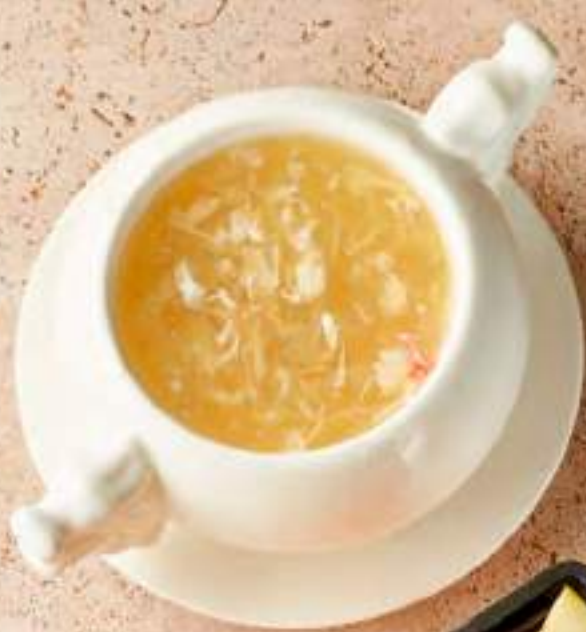
Императорский суп с акульими плавниками и крабом