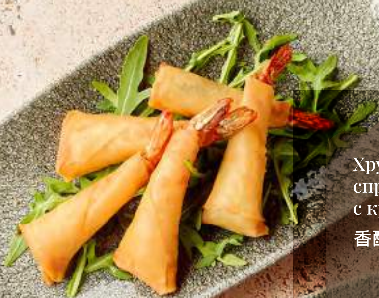
Хрустящие спринг роллы с креветками 香酥虾春卷