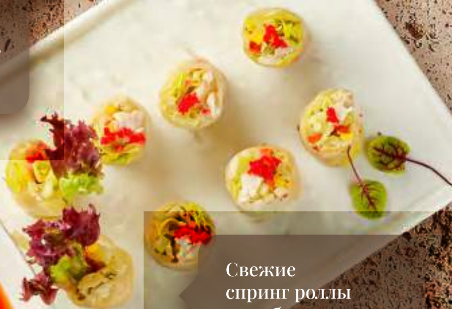
Свежие спринг роллы с крабом 米皮蟹肉时蔬卷