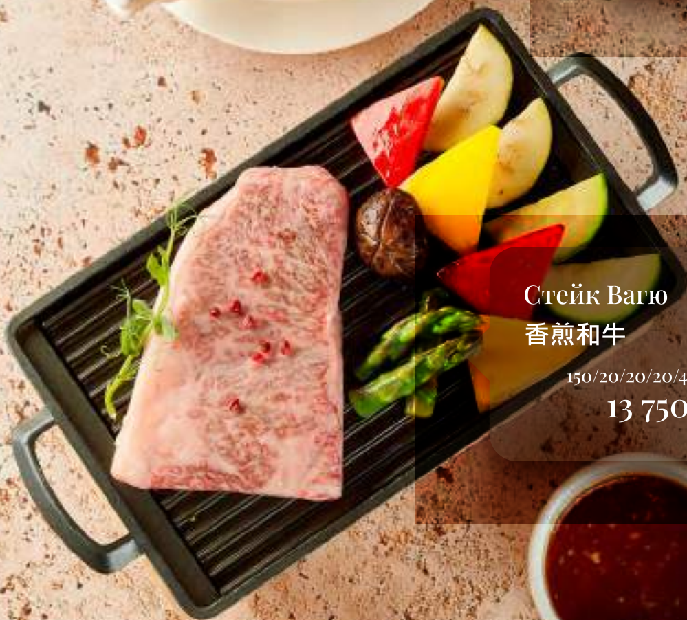
Стейк Вагю 香煎和牛