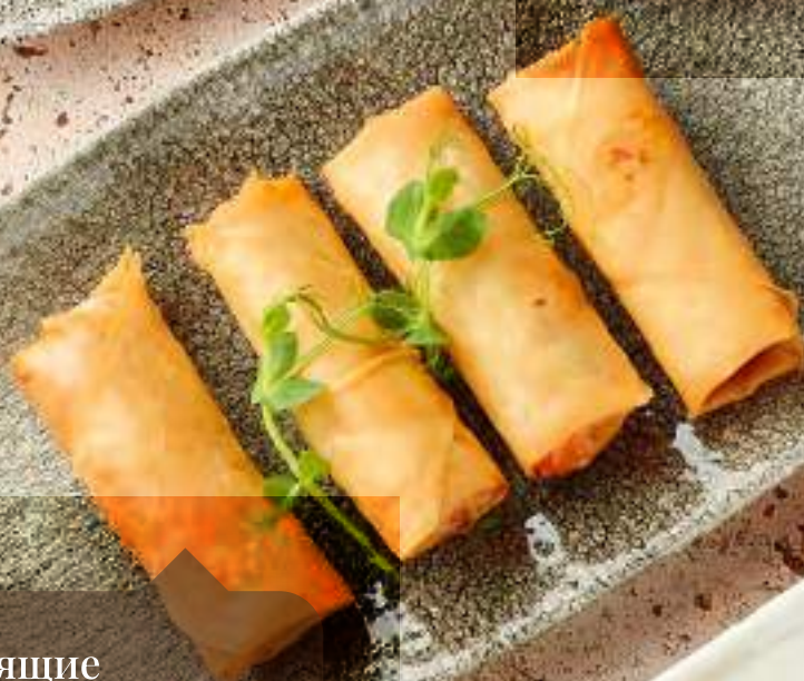
Хрустящие спринг роллы с овощами 香酥蔬菜卷