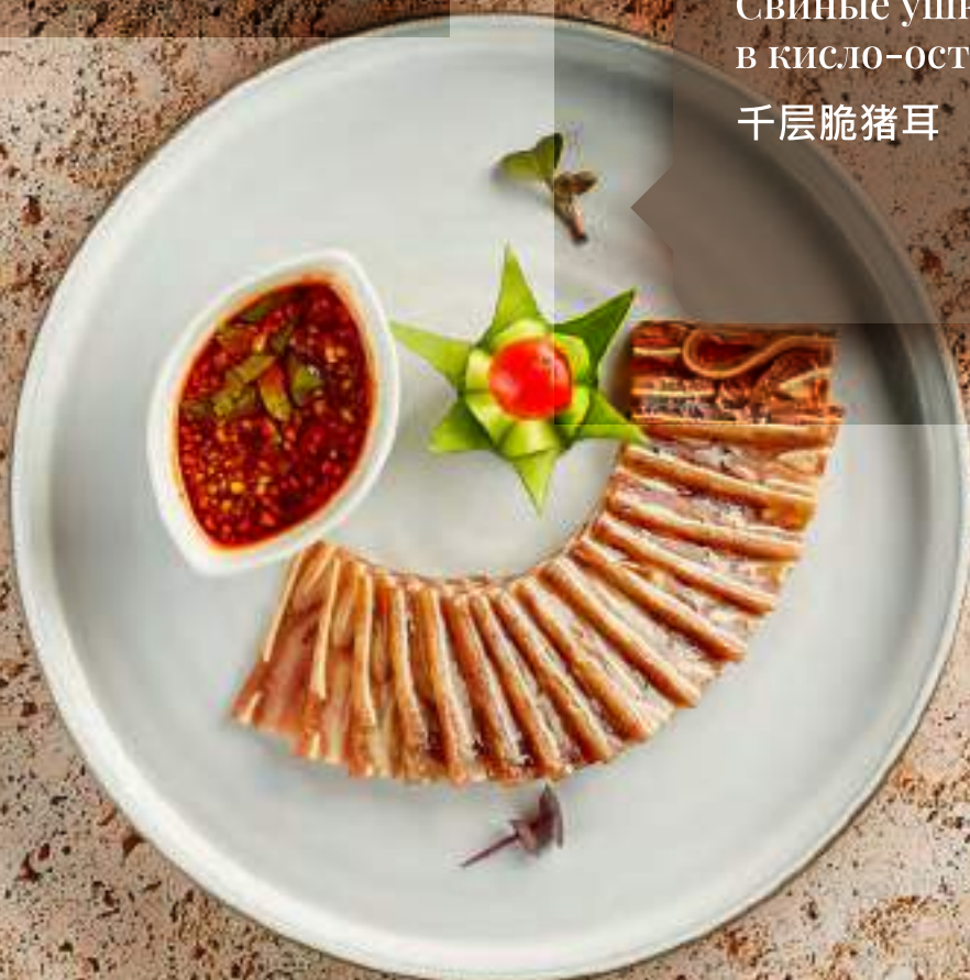
Свинные ушки в кисло-остром соусе 千层脆猪耳