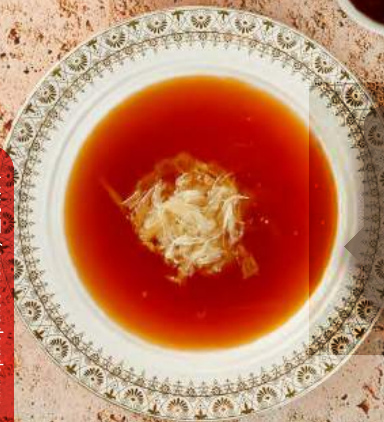
Императорский суп с акульими плавниками «Джин Гоу» 红烧大鲍翅