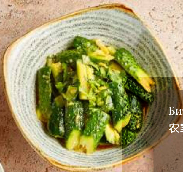
Битые огурцы 农家拍青瓜